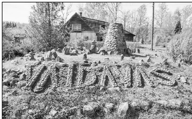
Mājas vizītkartē dominē akmeņi. Interesanti ir veidojumi no akmeņiem.